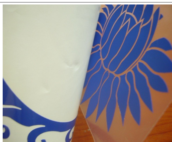
Одноразовый трафарет (пленка)