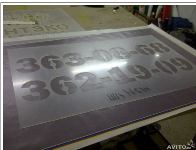
Многоразовый трафарет (пластик)